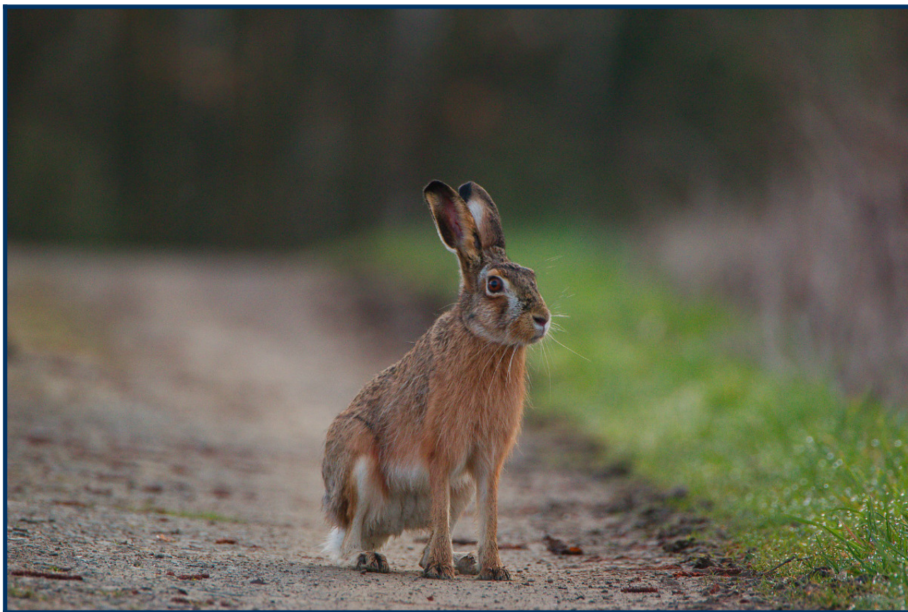
Zając szarak

terenów otwartych to myszy polne ( Apodemus agrarius ) i polniki ( Microtus arvalis ) wyrządzające niekiedy szkody w uprawach.